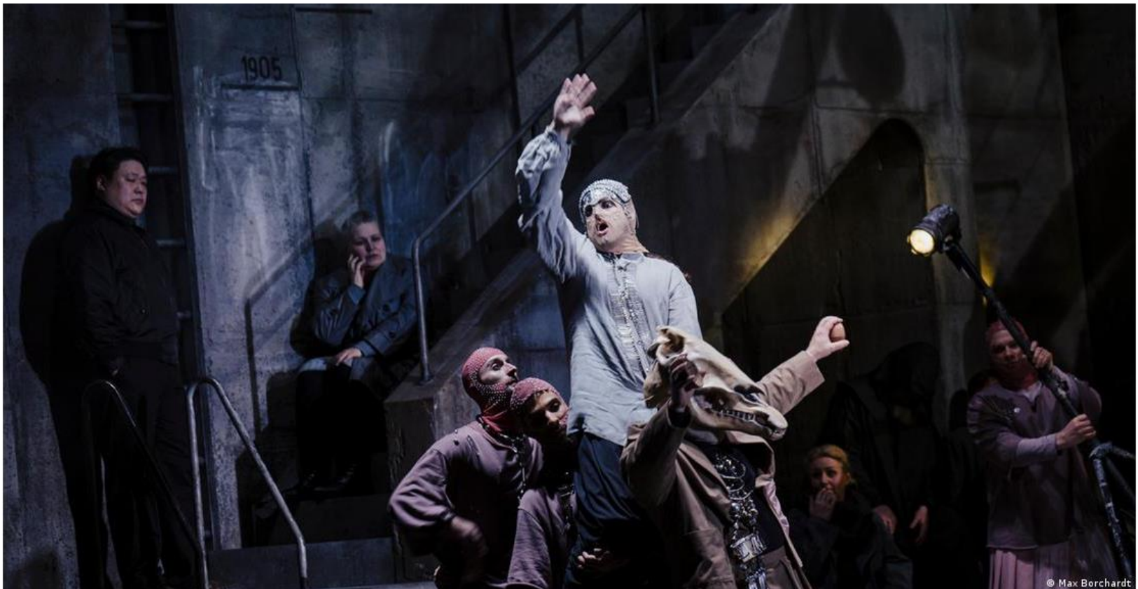
Преданный конь Канхака перевез принца Сиддхартху через реку Анома, когда тот решил покинуть свою прежнюю жизнь во дворце

После премьеры Дэвид Радкин поделился с DW своими впечатлениями: "Это очень поэтичная постановка. Мне понравился стиль". В качестве примера он отметил сцену с любимым конем Сиддхартхи, сыгравшем ключевую роль в истории - именно он перенес принца за пределы дворца, с чего начался духовный поиск Будды. В постановке коня изображают шесть актеров, на одном из которых надет огромный конский череп. Дэвид Радкин считает, что синтез театральных традиций и мультимедийных технологий позволяет подчеркнуть драматизм и придает постановке динамичность.