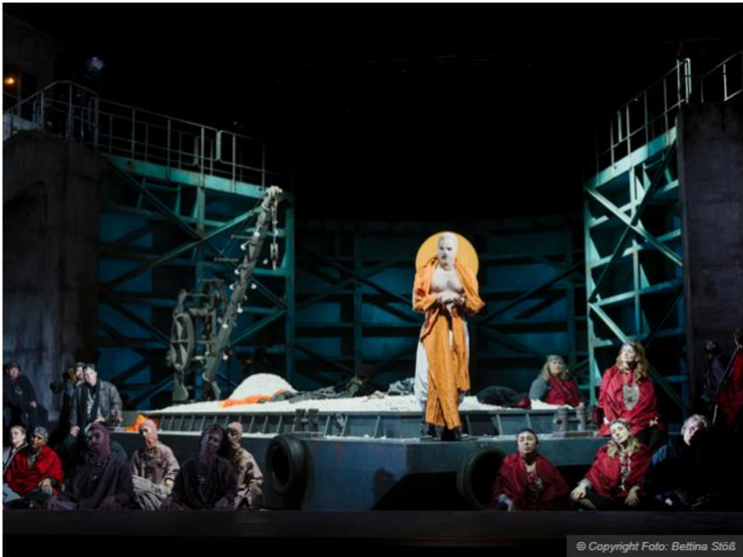
Awakening Param Vir Besuch am 1. März 2026 Uraufführung

https://www.opera-online.com/de/columns/rsiepmann/spiel-auf-zwei-ebenen-gerat-zum-sturmlauf-an-fiktiven-und-realen-szenen