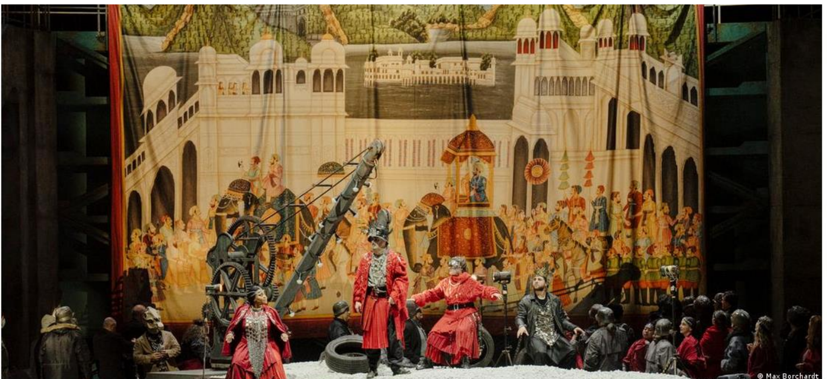
Согласно буддийским легендам, принц Сиддхартха Гаутама родился в Лумбини на территории современного Непала в королевской семье клана Шакья, но отказался от мирской жизни

Начальный эпизод повествует об отпрыске из королевской семьи, которого лошадь сбросила за пределами родительского дворца. Так 29-летний принц впервые видит старость, болезни и смерть. Он с горечью осознает, что эти состояния неизбежны для каждого, и никакие богатства и удовольствия не помогут избежать невзгод. Но как освободиться от страданий?