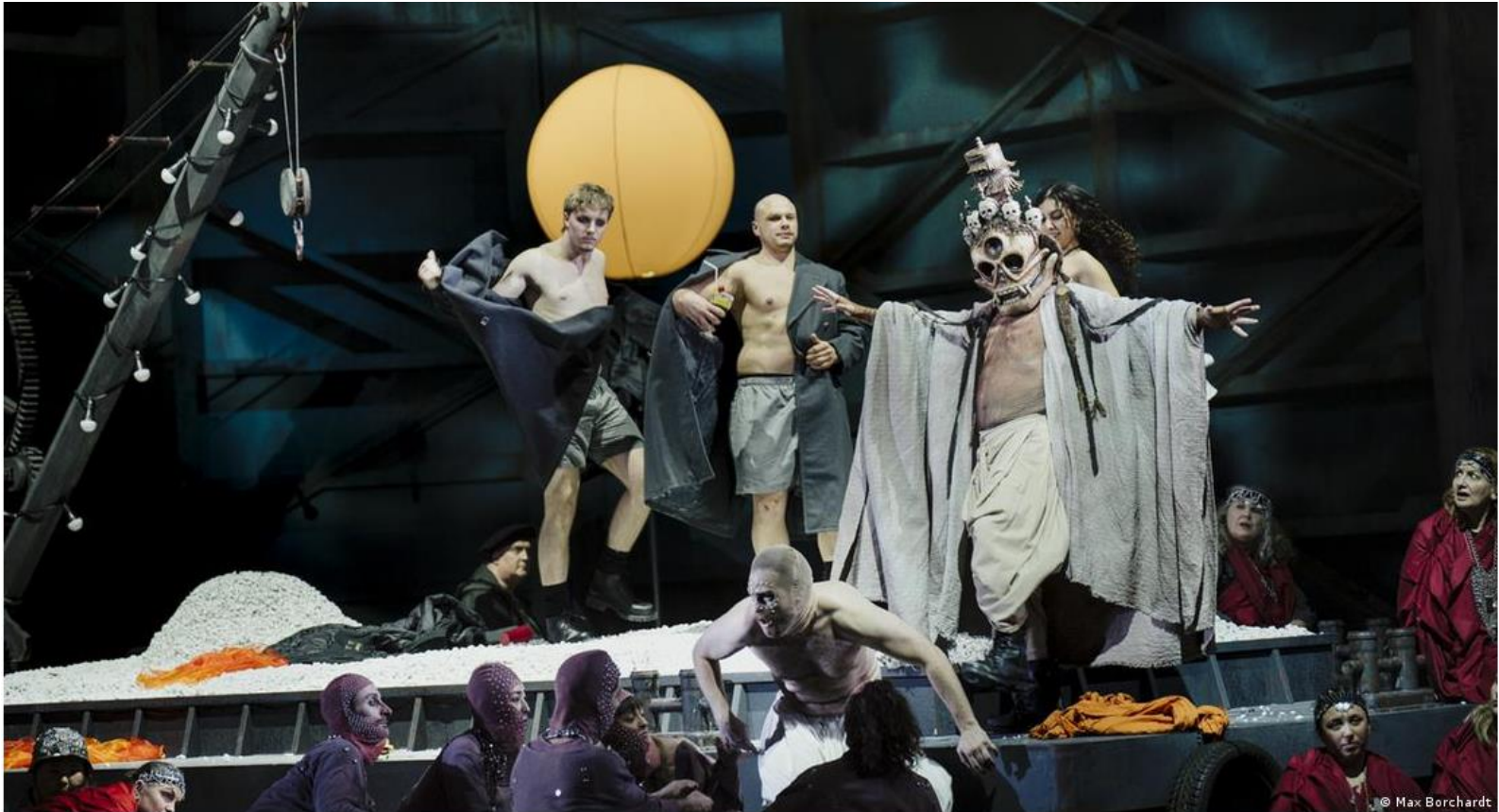
Сцена из оперы Awakening в Боннском театре